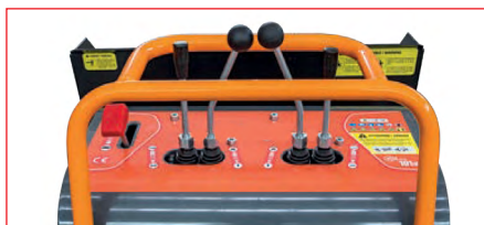
Pannello di controllo / Control panel