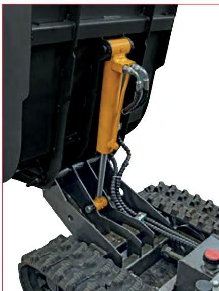
Ribaltamento idraulico / Hydraulic overturn